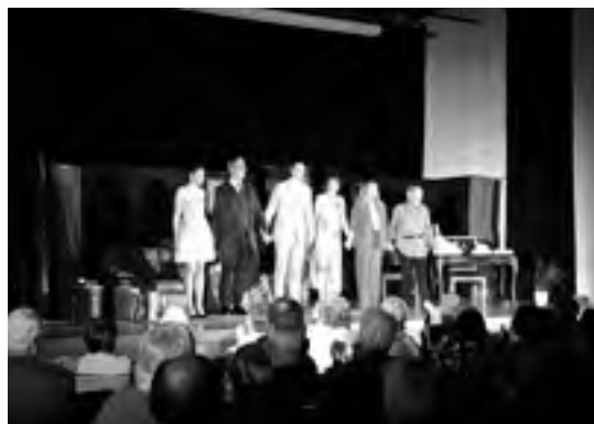
Soirée théâtre avec la troupe des Arti'Shows