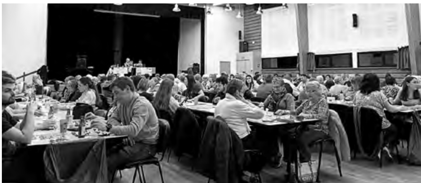
Soirée LOTO à la salle Steredenn

Néanmoins, pour que l'ALPE puisse continuer à exister et à soutenir les projets de nos enfants, nous avons besoin de l'aide du plus grand nombre. Nous invitons ainsi l'ensemble des parents à s'impliquer, même ponctuellement, que ce soit pour donner un coup de main lors d'une action ou pour préparer un gâteau. Chaque geste compte et contribue à la pérennité de l'association.